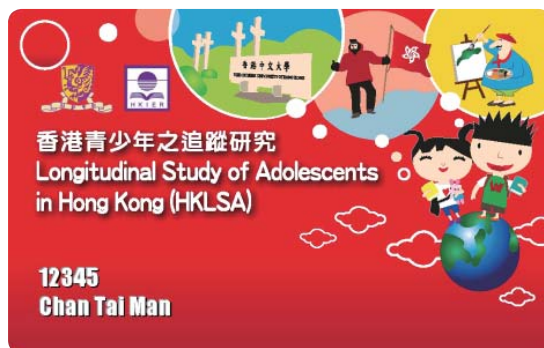
Membership card for students participating in HKLSA