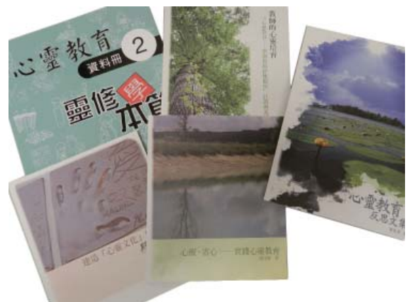
心靈教育計劃出版物

本計劃自開展以來，已出版了四冊有關心靈教育學與教的文集和教材並一份研究報告。我們將繼續努力整理未來的實踐與研究成果，期盼這些成果能支援學校、教師、家長、學生及有心人，讓彼此互相扶持、心靈共同成長。