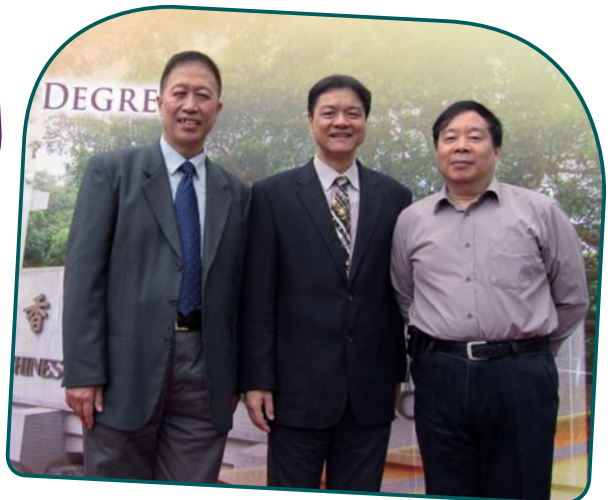
01 2001年，香港教育研究所代表團拜訪國家教育部袁貴仁副部長、國家語委領導