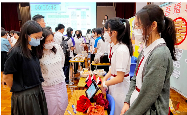
協作中學的學生在成果展示日上製作攤位，自選一項「非遺」項目介紹其特色，並分享傳承方案；圖中小組為傳統喜餅加入創新元素作推廣