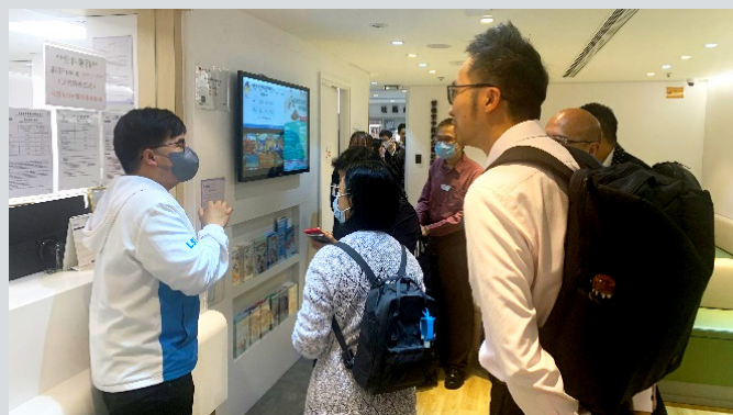
樂善堂醫療團隊代表引領學員視察該機構基層醫療中心的服務範圍，加強教育局同工了解機構社區資源的運用策略

「領導培訓及發展課程（非教學教育專業職系）」今年以先導計劃形式進行，藉此希望教育局不同部門、分區的同工，走出教育領導領域，擴闊視野，以期於領導力價值及策略、戰略管理、學校資源、轉變管理、危機處理各方面，得到更多啟發。學員嘗試把課堂上學到的理論學說，結合三次機構參觀訪談，作個人反思，再與小組組員討論分享，最後於學習成果分享會上，彼此砥礪交流，形成專業學習社群，在此平台上互相鼓勵持續學習，增強同工專業操守和領導信心。