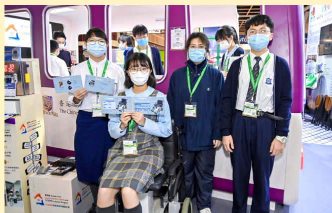
The Elevating Wheelchair invented by students from Lok Sin Tong Yu Kan Hing Secondary School

Funded by the Hong Kong Jockey Club Charities Trust and spearheaded by the Centre for Learning Sciences and Technologies (CLST), Jockey Club Community Care and STEM in Action Project has marked three years of significant achievements. Collaborating with six secondary schools, the project has yielded 21 ground-breaking technological products tailored to the needs of the underprivileged. Guided by the mentors from the Faculty of Engineering of The Chinese University of Hong Kong (CUHK), social service organizations and entrepreneurial circles, student innovators have breathed life into these creations. The fruits of their labour were showcased at the Learning and Teaching Expo 2022 held at the Hong Kong Convention and Exhibition Centre.