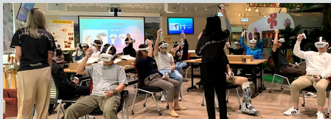
參觀新世界建築（現為協盛建築有限公司），機構以 VR 遊戲形式，讓多位副校長和參與同工進行團隊建立及培訓

參與計劃的學校領導既有理論研習、個案討論和同儕交流互動，更有機會到非牟利（慈善）機構、商界企業作機構考察，與領導層代表對話，探討領導力在不同處境所發揮的作用，包括營運思維、拓展業務的策略和新思維。同時，又從參觀不同部門的體驗，幫助教育領導從企業領袖身上取經，促進個人對理論、考察和個人領導風格的反思；藉着專業社群的建立，開展小組計劃和成果展示，得到導師及同儕回饋，並把有關學習成果與業界和參與機構分享。