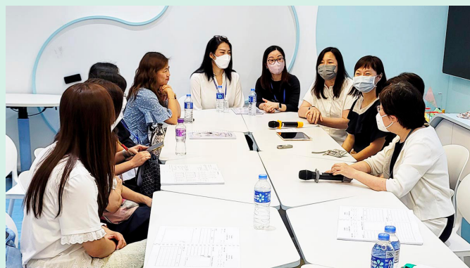
能實地觀摩「匯進學校」的實踐經驗和成果，為協作學校代表帶來莫大啟發，並加強日後籌辦同類活動的信心