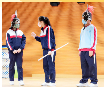
學生學習粵劇的文化和表演特色後，分組演出《花木蘭》選段作學習成果展示

2022-23 學年有四所小學和兩所中學參與計劃，以不同主題切入，設計校本跨範疇課程，如粵劇表演、飲食、客家、廣府、養生等文化；學生經過課堂學習和實踐體驗，親身領會「非遺」項目的文化特點，繼而以演出、市集攤位、作品展示、匯報等互動形式，呈現豐富的學習成果。在與教師協作發展校本課程的過程中，特別探討如何訂定研習主題、安排知識輸入、設計探究和體驗活動、引導學生整理和總結知識經驗、安排多元展示形式等，並鼓勵跨學科協作，推動不同學科的教師在設計課程和教學過程中緊密配合。期間所得的校本課程實踐經驗，於 2023 年 9 月舉行的全港分享會發表。