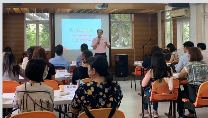
教育局同工到神託會機構，考察加強非教學人員的領導力和建構跨部門的專業學習社群是在次學習成果分享會上，更有幸請來教育局首席助理秘書長（專業發展及培訓）李惠萍女士，為各級教育局同工打氣，各人均喜不自勝，非常投入，使課堂上學習交流氣氛更濃厚。