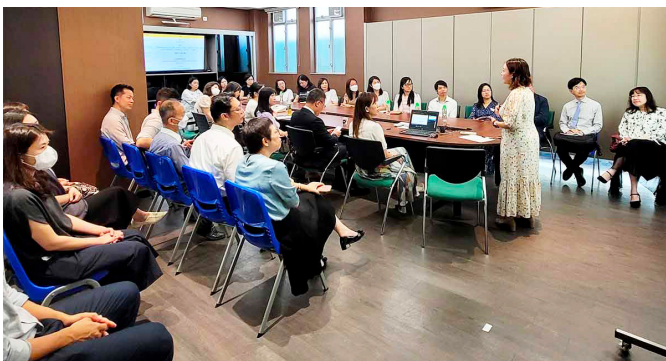
在「匯進學校」的專業交流環節中，QSIP 團隊連同學校領導分享校本課程的規劃和設計細節，所提及的具體策略令協作學校代表獲益良多

除了為協作學校提供校本專業支援外，QSIP 深明跨校專業交流能擴闊同工視野，因而以「匯聚優質意念、共享改進心得」為目標，凝建「匯進學校」跨校交流網絡，邀請多所曾與 QSIP 協作並累積豐富經驗的學校，安排到校觀摩及交流。在 2022–23 學年，QSIP 進行了五次「匯進學校」交流活動，有接近 30 所協作學校的領導和教學團隊參與，特點是首先安排參加者親身到校參與學生的學習成果展示活動，隨後與該校代表對談，交流校本課程規劃的部署和考慮，如課程的宏觀部署、教學策略背後的構思及推行方式、行政配套等，內容專業又充滿啟發性，令協作學校代表從中汲取經驗，加強將來籌辦同類課程的信心。