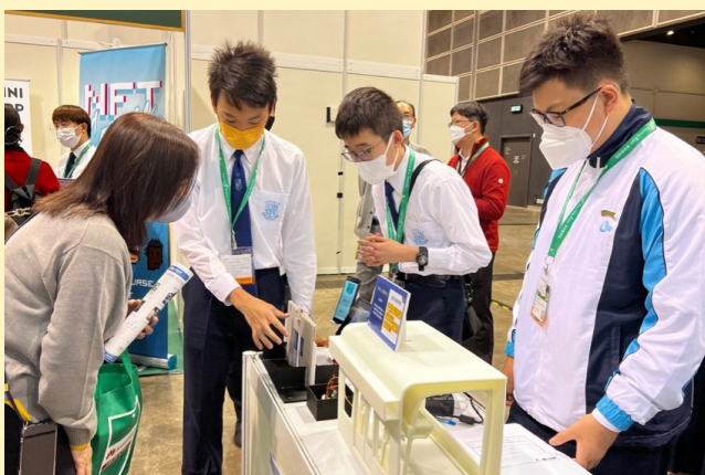
The Railway Safety Device for the Hearing-impaired crafted by students from Carmel Holy Word Secondary School

bus arrival; the Necklace, envisioned by students from Pentecostal Holiness Church Wing Kwong College, detects obstacles and provides warnings to visually challenged users; the Railway Safety Device, a brainchild of students from Carmel Holy Word Secondary School, deploys light flashes to prevent door crush injuries for the hearing impaired. Students masterminding such ingenious inventions walked the visiting public through their first-hand experiences with the complete “design-thinking process” spanning from conception to market launch.