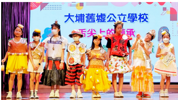
協作小學的學生施展渾身解數展示他們的「非遺」時裝，又舉辦「大笪地」攤位，向其他年級的同學展現「非遺」飲食的特色

香港教育研究所轄下的優質學校改進計劃 (Quality School Improvement Project, QSIP)，過去獲田家炳基金會捐助，開展多個不同計劃。其中「傳承『動』起來：香港中華文化課程設計與推廣」自 2017 年展開，至今已進入第三期。計劃以「香港非物質文化遺產」(下稱「非遺」)為主題，與參與學校共同發展具校本特色的中華文化課程，並透過協作令教師掌握設計和實踐跨範疇學習活動的原則和策略，以提升專業能量。